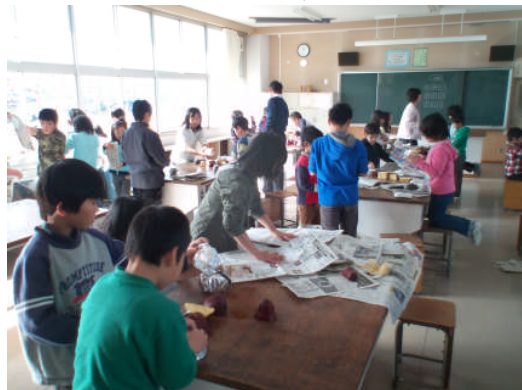
みんなで準備をしています

全校がもっと仲良くなれないかと考え、地域からお借りした畑で、各学年が育ててきたサツマイモを使って、焼き芋大会を校庭で今年初めて開催しました。6年が1年と2年が5年とそして3、4年生が仲良し学年の組になって、前日から準備したり、当日は火の中にサツマイモを入れました。焼き上がるまで、校庭でいろいろなゲームをして全校が交流することができました。1時間もすると、校長先生から「そろそろいいぞ」というOKがでて、全員でお芋を取り出しました。アルミを開くといいにおいがします。全校でおいしく焼き芋をほおばることができました。木材等で丸山木材さんにはお世話になりました。ありがとうございました。